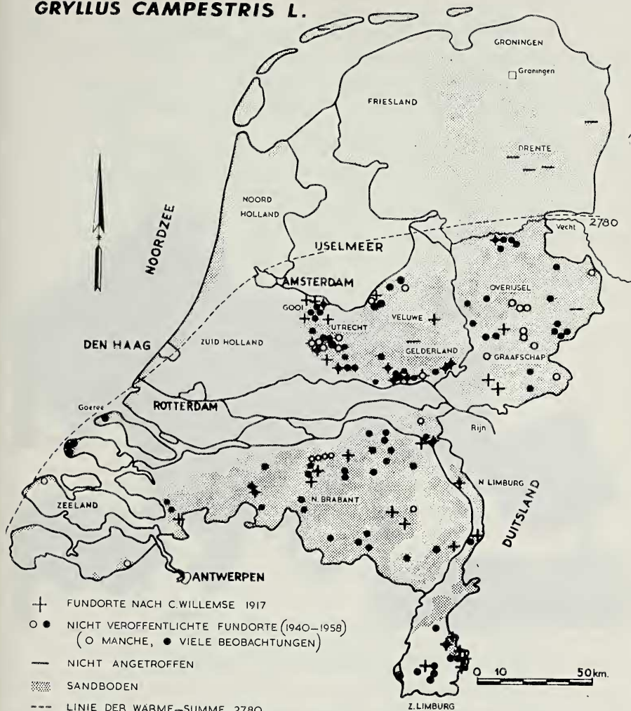
Abb. 1. Fundorte der Feldgrille in den Niederlanden.

Da die Tiere trotzdem fehlen, kann man von einer Nordgrenze des Verbreitungsgebietes sprechen, um so mehr weil auch in den Nachbargebieten eine solche Grenze offenbar ist. In Abb. 2 ist die Verbreitung der Feldgrille in England laut Angaben von RAGGE (1965) eingetragen worden, während in Deutschland die Nordgrenze ZACHERS (l.c.) unter Verwendung einiger Daten TISCHLERS (1949) angegeben ist.